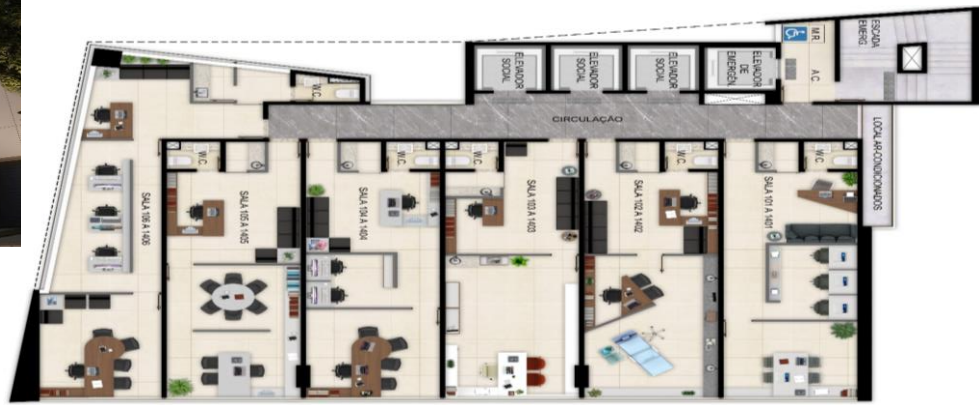
Sala 6 Final 05 – 60,35 m 2 Sala 5 Final 05 – 45,41 m 2 Sala 4 Sala 3 Finais 04, 03 e 02 – 45,63 m 2 Sala 2 Sala 1 Final 01 – 46,50 m 2

Cafeteria | Bussiness Center | Auditório Panorâmico | Terraço Cobertura | Garden Living | Vagas com recarga para carro.